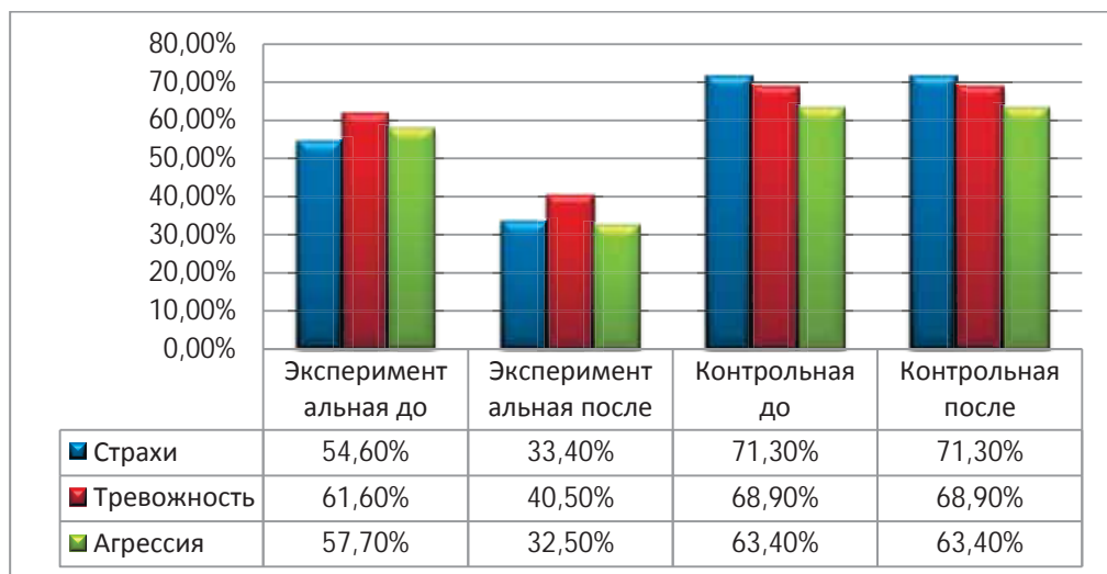
Гистограмма 1. Сравнение показателей экспериментальной и контрольной групп до и после проведения коррекционной работы

Тревожность была выявлена в экспериментальной группе у 140 (61,6%) респондентов 82/58, в контрольной из 164 у 113(68,9%): 58/55. При повторной диагностике уровень тревожности был выявлен у 92 (40,5%): 64/28 (с 61,6% понизился до 40,5%). Агрессия обнаружена была у 131 респондента в экспериментальной 131 (57,7%): 59/72 и у 104 (63,4%): 46/58 в контрольной. К концу коррекционной работы, после повторного диагностирования показатели снизились до 74 (32,5%): 33/41 (с 57,7% до 32,5%).